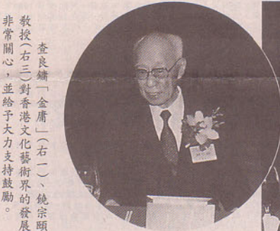
查良鏞(金庸)(右一)、饒宗頤教授(右二)對香港文化藝術界的發展非常關心，並給予大力支持鼓勵。