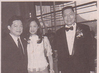
音樂大師莫華倫伉儷與劉詩昆一起，為文化藝術界活動進行精湛表演