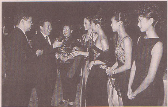
國務院文化部長孫家正(左二)出席香港文化藝術界國慶宴會與香港影視界明星藝員歡談

香港文化藝術界為熱烈慶祝五十二周年國慶，定於九月二十四日(星期一)下午五時至六時半，假座香港中環富麗華酒店翡翠廳隆重舉行慶祝中華人民共和國國慶酒會。