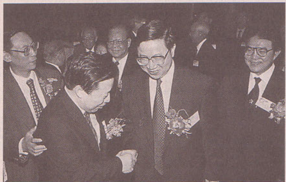
右起：霍震霆、姜恩柱、孫家正、區永熙