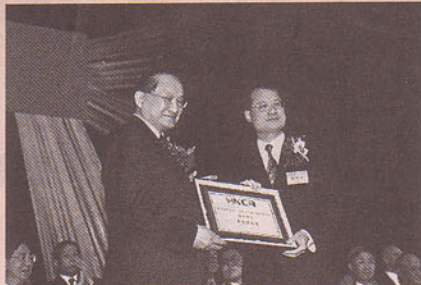
本會榮譽會長蔡冠深先生向金庸先生頒發證書