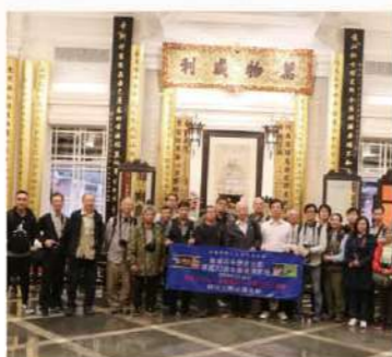
攝影團在東華三院總部大禮堂合影。