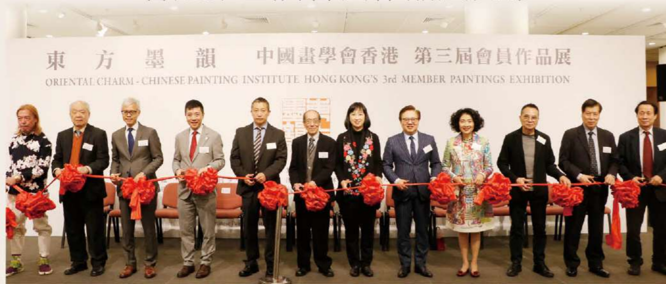
主禮嘉賓於會開幕典禮進行剪綵儀式。

中國畫學會香港成立於2014年，提倡繼承及發揚中國畫傳統，團結香港及周邊地區水墨畫界友好，共同探索當代中國水墨藝術發展。為慶祝學會成立五周年，中國畫學會香港於2019年2月22日至28日於香港中央圖書館展覽館全館隆重舉辦「東方墨韻」—中國畫學會香港第三屆會員作品展，展出二十八位成員最新創作。展覽並蒙香港藝術發展局資助、香港各界文化促進會參與主辦。