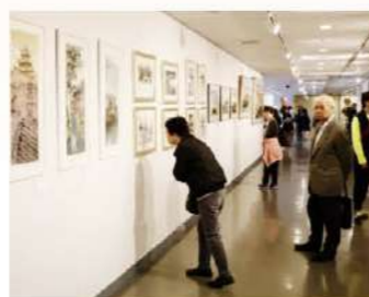
現場觀眾細心欣賞畫作。