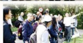
攝影團在天文台聽工作人員講解天文台設施。