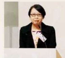
香港特區政府民政事務局長馮永萍副秘書長致辭。