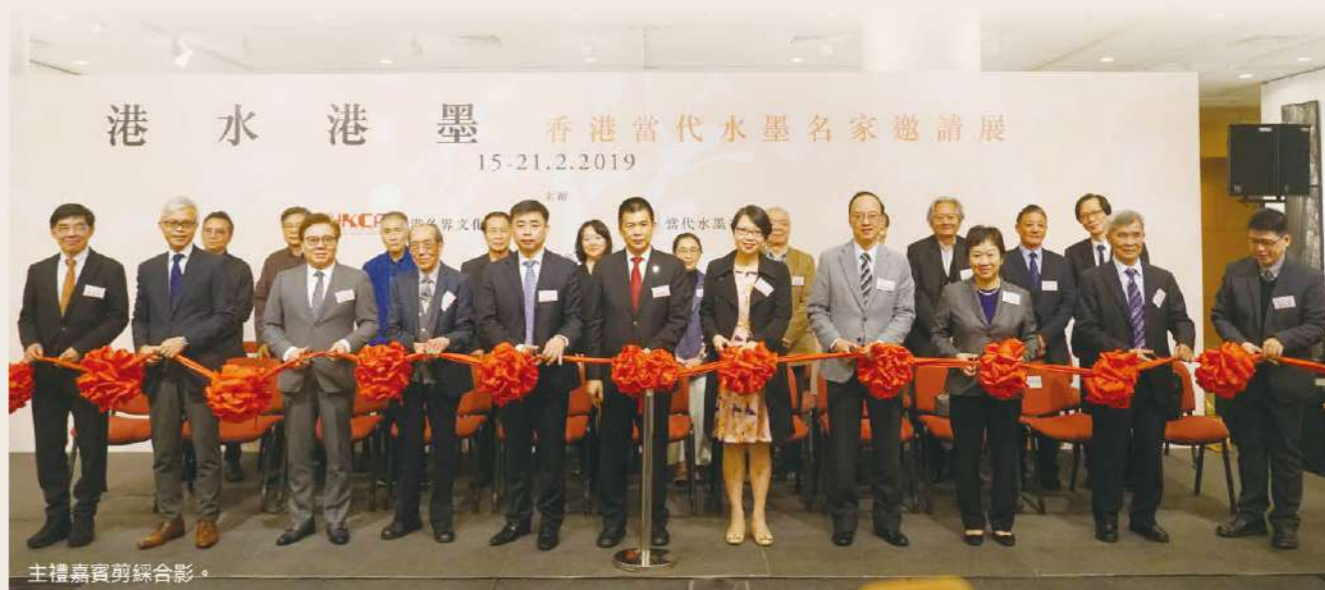
主禮嘉賓剪綵合影。