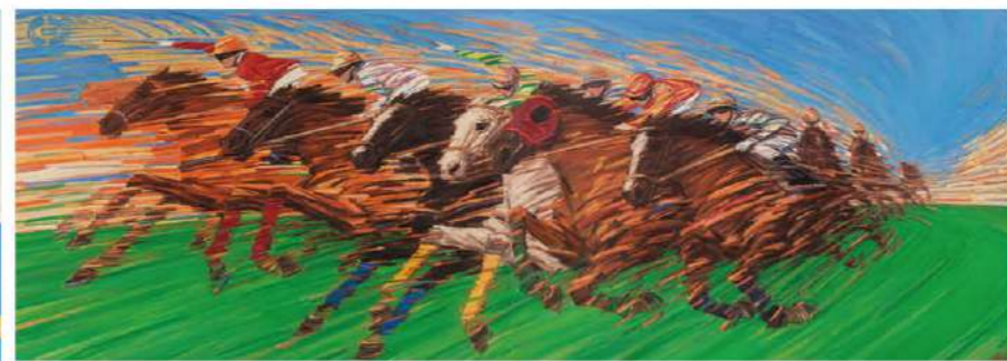
白曉剛 馬在跑 140x400cm 油彩布本