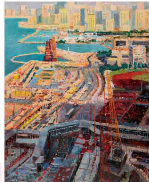
沈平 陽光下的維港 100x110cm 油彩布本