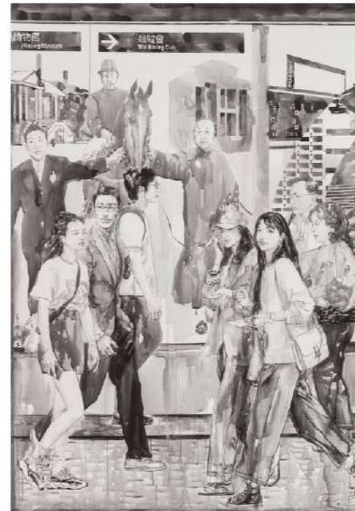
王穎生 繁榮香港 140x200cm 水墨布本