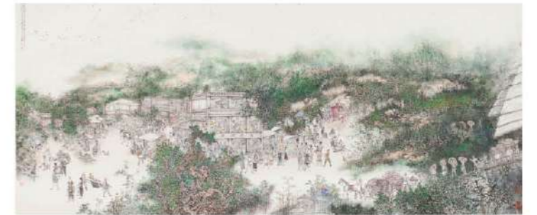
蕭暉榮 滄桑歲月圖 167x197cm 水墨設色紙本