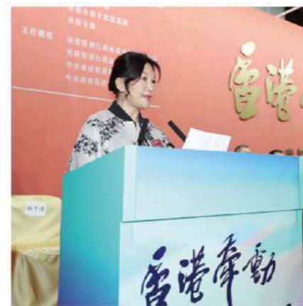
文促會主席翟美卿致辭。

出席開幕式的主禮嘉賓還有：全國人大常委譚耀宗、全國政協常委林淑儀、全國工商聯副主席劉志強、民建聯主席李慧琼、立法會議員馬逢國、中國書法家協會香港分會主席施子清、文促會永遠榮譽會長楊釗。協辦機構代表有香港友好協進會副秘書長盧瑞安、香港義工聯盟常務副主席陳紅天、香港大公文匯傳媒集團董事姜亞兵、藝育菁英基金會主席方黃古雯、紫荊雜誌社社長楊勇、孫少文基金會主席孫燕華、香港畫家聯會會長陳家義、網上青年協會主席何玉慧、香港教育工作者聯會會長黃均瑜、香港學生活動基金會副主席徐小龍、香港僑界社團聯會常務副會長梁淦基等。