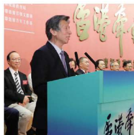
中央美術學院院長范迪安致辭。