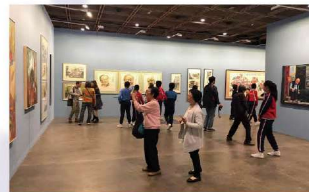
名家薈萃，吸引逾萬市民進場參觀。