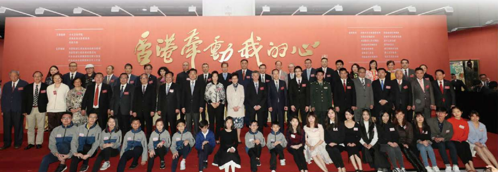
香港牽動我的心展覽開幕式主禮嘉賓合影。前排左起：施子清、馬逢國、李慧琼、林淑儀、劉志強、譚耀宗、劉江華、陳冬、謝鋒、翟美卿、林鄭月娥、范迪安、楊健、蔡加讚、陳亞丁、譚錦球、盧偉國、朱文、楊釗、馬浩文、蕭暉榮。