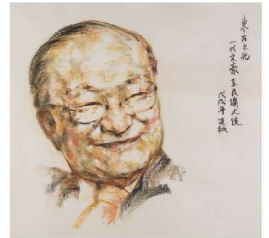
朱達誠 東方之光——代文豪查良鏞大俠 80x80cm 粉彩紙本