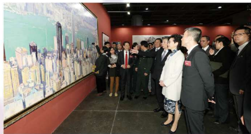
林鄭月娥、謝鋒等在范迪安陪同下參觀展覽。