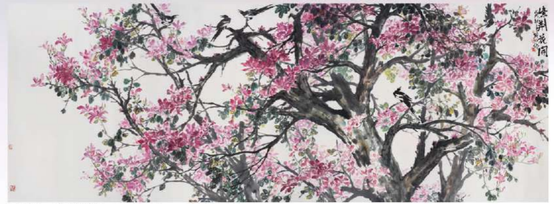
岳影山 紫荊花開 215x580cm 水墨設色紙本