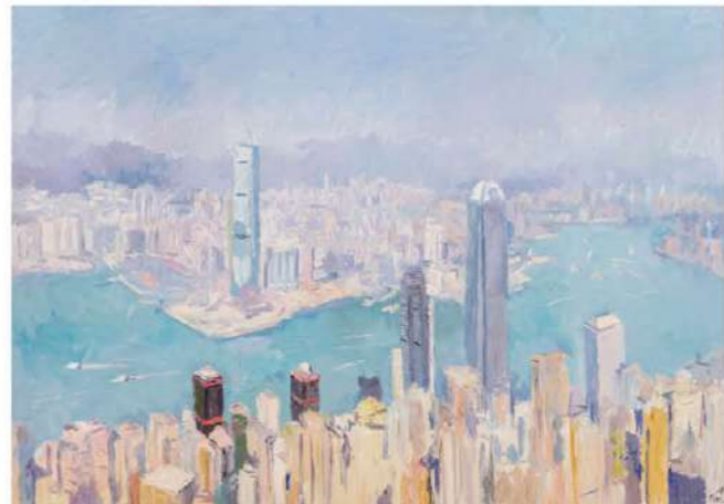
張路江 金色維港 140x200cm 油彩布本