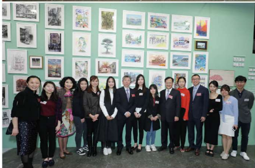
除中央美術學院及香港藝術家作品外，同場亦展出六十位青少年的香港主題作品。圖為嘉賓攝於青少年作品前。