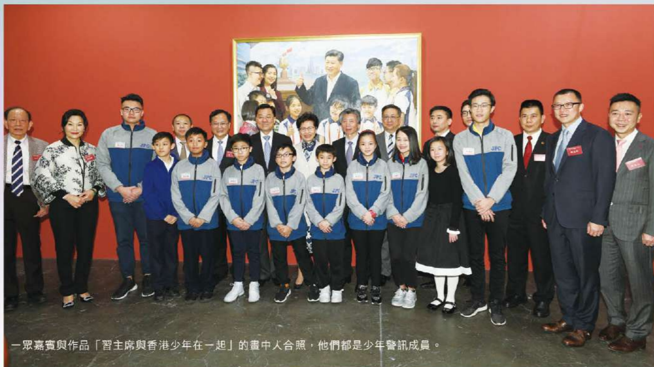
一眾嘉賓與作品「習主席與香港青少年在一起」的畫中人合照，他們都是少年警訊成員。