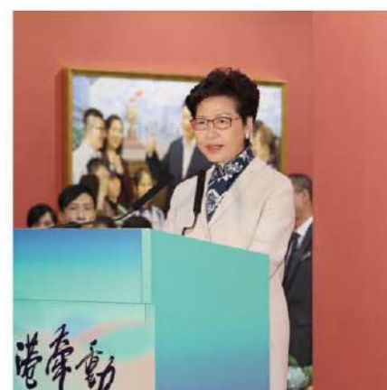
行政長官林鄭月娥致辭。