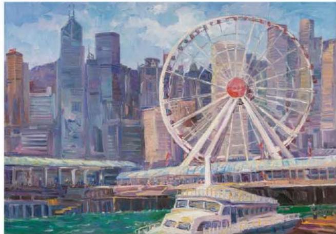
范迪安 中環摩天輪 140x200cm 油彩布本