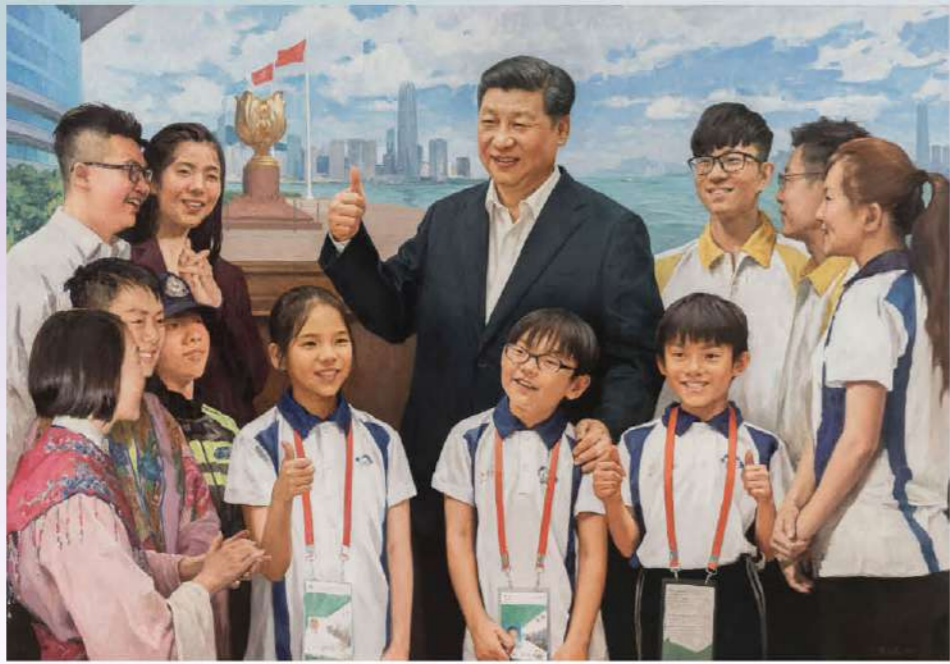
張義波 習主席與香港青少年在一起 140x200cm 油彩布本