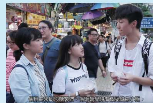
《港·灣尋味》三位主角探尋大灣區傳統滋味，獲中學組海絲盃及網上最具人氣獎。