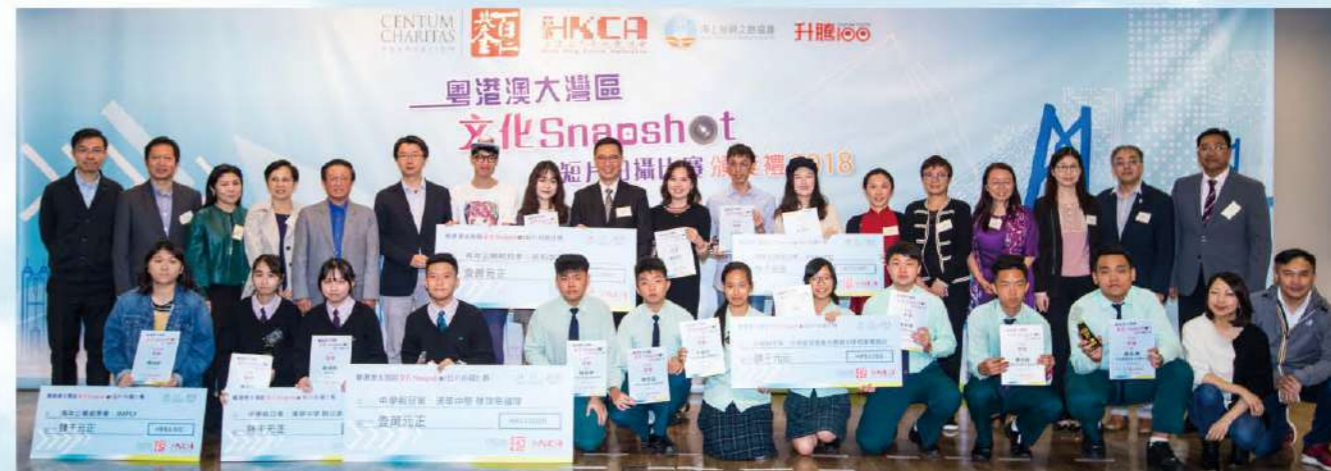
中學組及公開組三甲隊伍與頒獎嘉賓合影。

比賽評審們肯定參加者的用心及努力，展現出青年一代敢於創新、讓創意自由翱翔的活力。得獎者除可獲得獎金鼓勵外，冠亞季軍將獲邀參加主辦機構於 2019 年暑期舉辦的「中華文化之旅：大灣區珠海、中山交流考察」，海絲盃得獎者可赴內地參加「文化探索之旅」，進一步擴闊眼界。