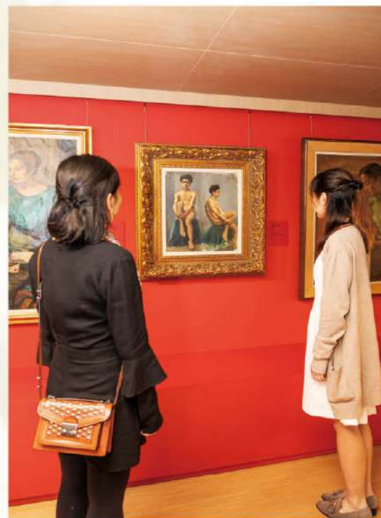
此次展覽呈現 20 世紀中國美術中西融合的風貌，以及一眾大師作品的多元風格。

一新美術館為是次展覽更策劃了五場講座，由總監楊春棠主講，以幾位大師的成就，介紹二十世紀中國繪畫的變化和意義，包括「徐悲鴻的時代」、「齊白石的空間」、「張大千的凡塵」、「李可染的水鄉」及「吳作人的大地」。