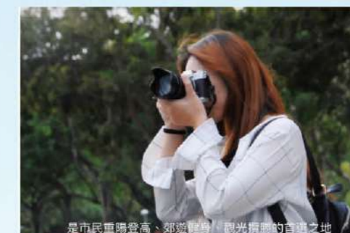
《我和我的女孩》介紹青年畫家青松筆下深圳的美好願景。