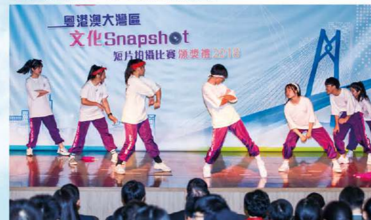
青年學生舞蹈表演充滿活力。