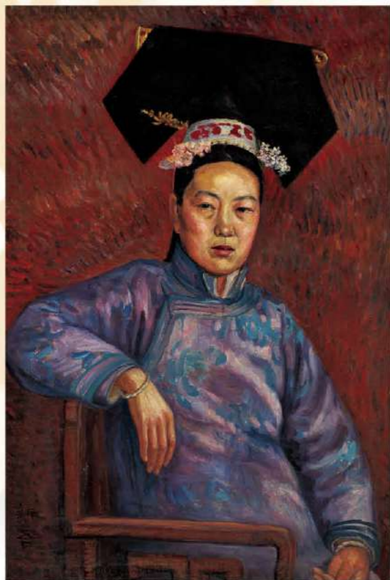
旗裝女人像——吳法鼎。吳法鼎是第一位在法國留學修讀美術的中國人。