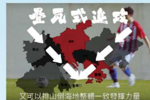
又可以排山倒海地整體一致發揮力量 中學組冠軍作品《波是這樣踢的》，以足球團隊合作比喻大灣區城市協作的無限潛力。