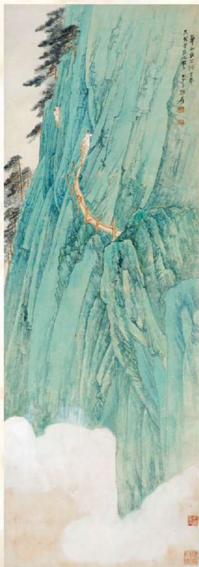
華山長空棧圖——張大千