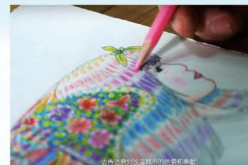
《走盡人生百態》主角深入惠州介紹美景美食，連奪季軍及網上最具人氣獎。