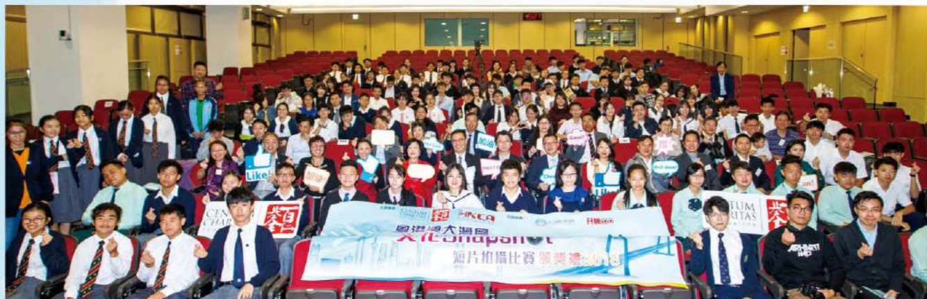
「粵港澳大灣區文化 Snapshot」短片拍攝比賽頒獎嘉賓與出席者大合照。當日頒獎嘉賓包括教育局局長楊潤雄、行政會議及立法會議員葉劉淑儀、中聯辦青年工作部副部長楊成偉、百仁基金副主席王紹基、香港各界文化促進會常務副會長孫燕華、升騰100行政總裁郭一鳴、海上絲綢之路協會總裁黃彥勳等。