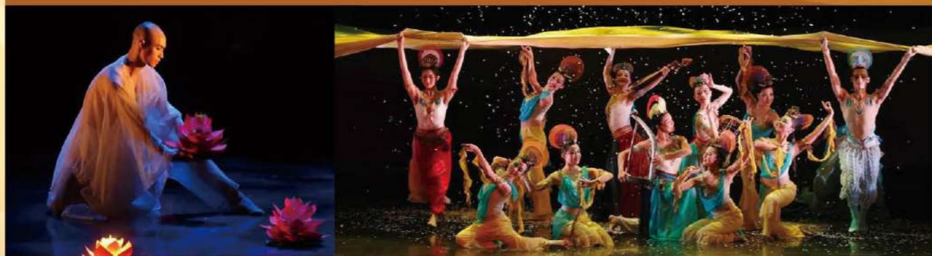
《緣起敦煌》演出劇照。演出者以舞蹈演繹敦煌美學。