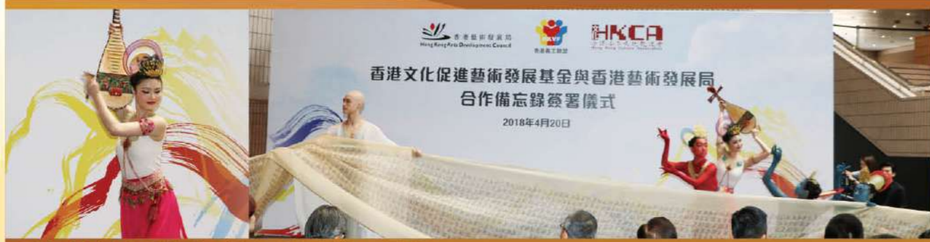
香港舞蹈總會舞者在儀式後即席演出《緣起敦煌》三段章節。