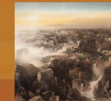
《一路好風光系列——古城曠望》 何百里（香港美協創會理事）