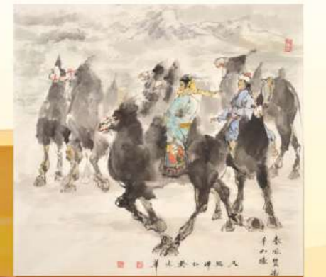
《春風質染千山綠》 尼瑪澤仁（中國美協顧問、中央文史研究館館員）

中央圖書館隆重舉辦「一帶一路」與香港發展畫畫名家藝術展，以慶祝香港回歸二十一周年、國家主席習近平提出「一帶一路」倡議五周年。文促會廣邀中國內地及香港著名藝術家參展，通過藝術語言展現「一帶一路」文化精神，逾百幅藝術佳作賞心悅目、淨化心靈，為5月香港一次難得的藝術盛宴。