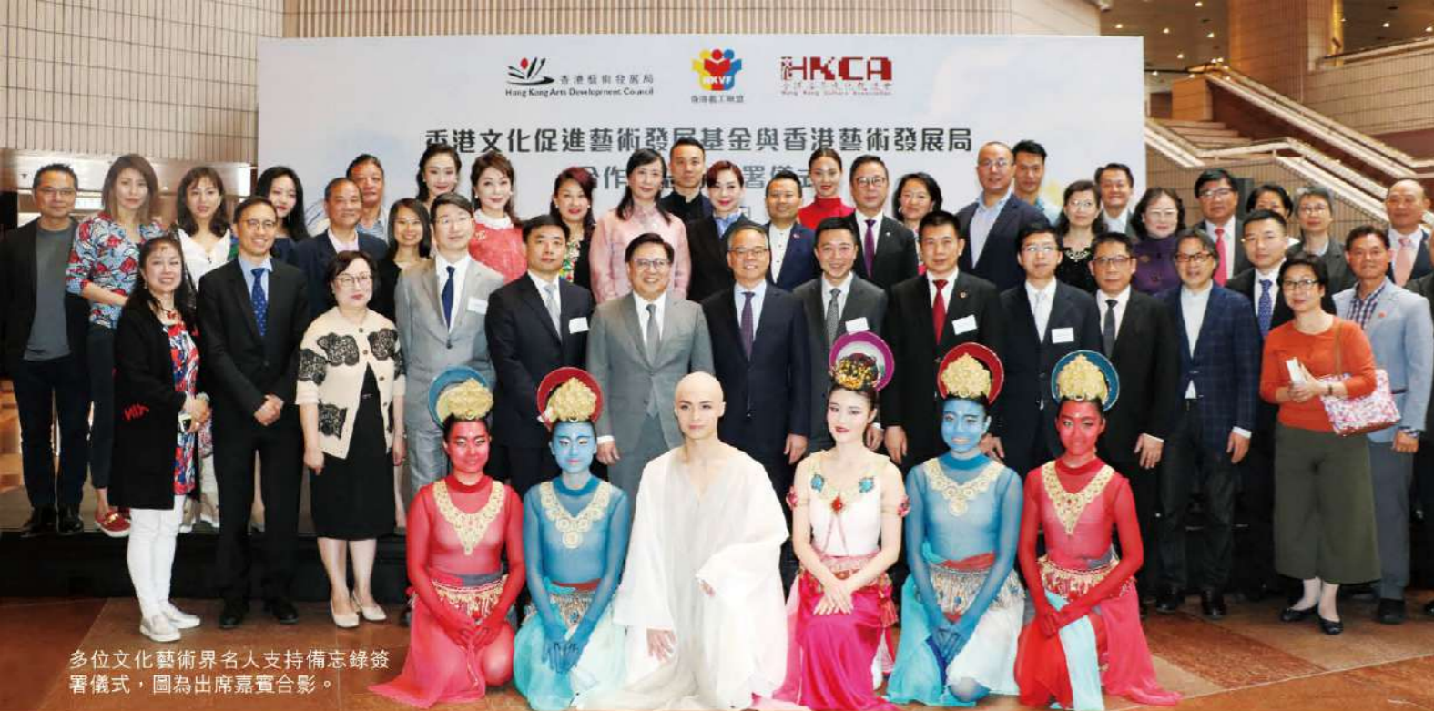
多位文化藝術界名人支持備忘錄簽署儀式，圖為出席嘉賓合影。