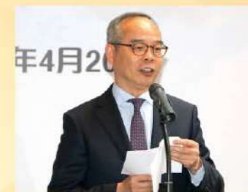
劉江華局長透露政府未來將投放更多資源於文化藝術領域。